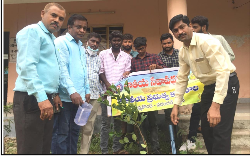
All the faculty members along with NSS units participated in Harithaharam on 31-07-2021