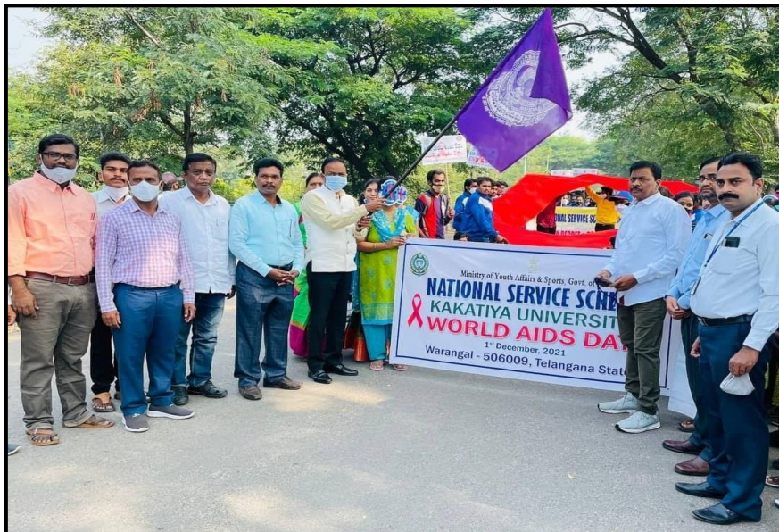
NSS Unit I Volunteer's participation in HIV / AIDS Rally on 01-12-2021 at Kakatiya University Warangal